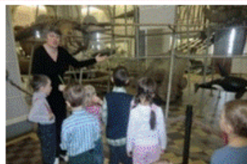
«Зоологический музей Зоологического института Российской Академии Наук»

Расширение и закрепление представлений по лексическим темам: «Осень», «Урожай»