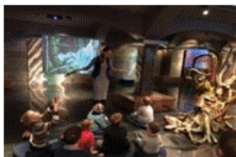
«Музейный комплекс Вселенная воды»

Расширение и закрепление представлений по лексическим темам: «Вода и её обитатели»