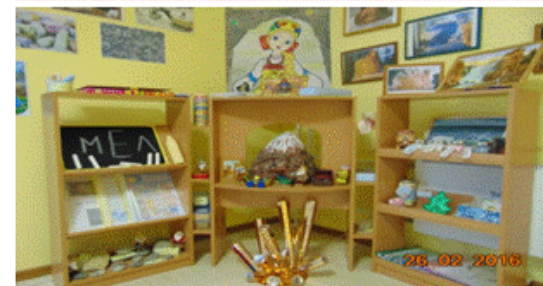
«Мини-музей минералов и часов»

Расширение и закрепление представлений по лексическим темам: «Сказки А.С. Пушкина»