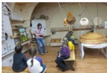
«Санкт-Петербургский музей хлеба»

Расширение и закрепление представлений по лексическим темам: «Осень», «Урожай»